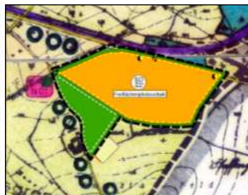
FNP – Fortschreibung

Der Gemeinde Burgkirchen a.d. Alz ist der Grundsatz des sparsamen Umgangs mit Grund und Boden und der daraus resultierenden Verantwortung sehr wohl bewusst, auch im Hinblick darauf, landwirtschaftliche Nutzflächen für bauliche Zwecke in Anspruch zu nehmen. Andererseits aber hat sie den Zielsetzungen der übergeordneten Raum- und Landesplanung Rechnung zu tragen, indem sie die regenerativen Energiequellen fördert und damit einen wichtigen Beitrag zum Klimaschutz leistet.